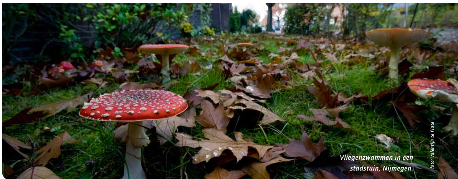
Vliegenzwammen in een stadstuin, Nijmegen.