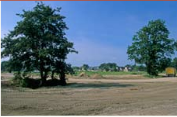
Bebouwing in het Reestdal.