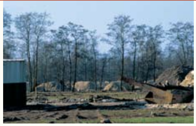
Slagenlandschap wordt bouwrijp gemaakt.