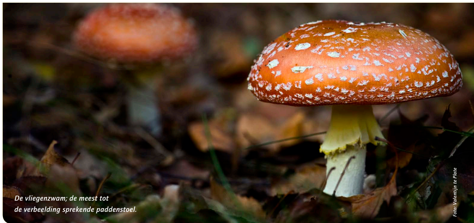
De vliegenzwam; de meest tot de verbeelding sprekende paddenstoel.