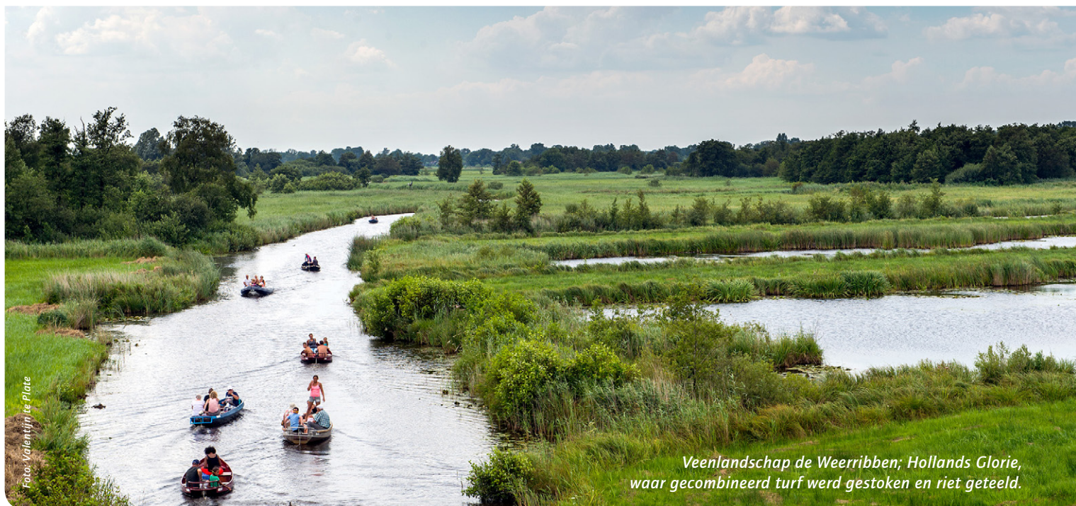
Veenlandschap de Weerribben; Hollands Glorie, waar gecombineerd turf werd gestoken en riet geteeld.