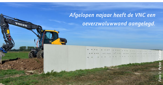
Afgelopen najaar heeft de VNC een oeverzwaluwwand aangelegd.

In het najaarsnummer van 2018 van Landschappelijk heeft u kunnen lezen dat wij in juli vorig jaar de eerste otterholt hebben aangelegd. Deze aanleg maakt onderdeel uit van het grensoverschrijdend INTERREG-project 'De Groen Blauwe Rijn Alliantie'. Binnen dit project, waarin de VNC samenwerkt met zowel Nederlandse als Duitse partners, zijn wij verantwoordelijk voor de aanleg van zogenoemde 'stepping stones': verblijfplaatsen ter bevordering van de migratiemogelijkheden van aquatische diersoorten, zoals otters, oeverzwaluwen en ijsvogels.