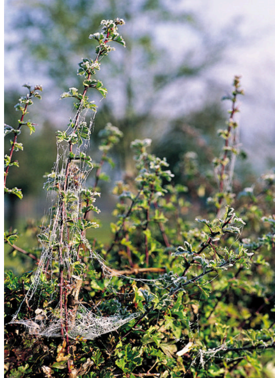
Knip- en scheerheg overtrokken met spinnenwebben.

Iedereen die zijn land wil afbakenen, moet levende heggen laten prevaleren boven het levenloze prikkeldraad. En daarmee het goede voorbeeld geven aan de boeren. Dit geldt zeker voor terreinbeheerders. Verplaats je in eens een hommel, bij, vlinder, kikker of pad. Geef ze handvatten in het huidige aangeharkte levenloze land. Heggen – ook knip- en scheerheggen van een gezonde omvang – bieden dan houvast. We moeten weg uit het dogmatisch denken; alles is nog altijd beter dan prikkeldraad.