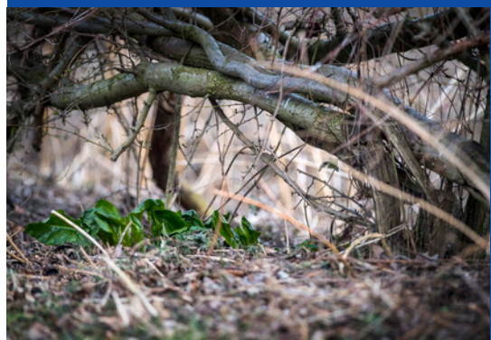
Ontluikende aronskelken onder een vlechthege.